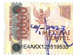
URAY GAPIMA ABRINATO, M.H.